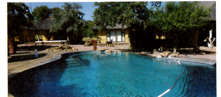
9 dage i luksus på 5-stjernet Matswani Elephant Lodge